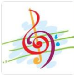
Roland E-A7 Kullanicilari