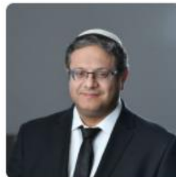
איתמר בן גביר