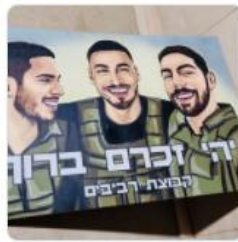
משפחת הכדורגל רביבים דימונה