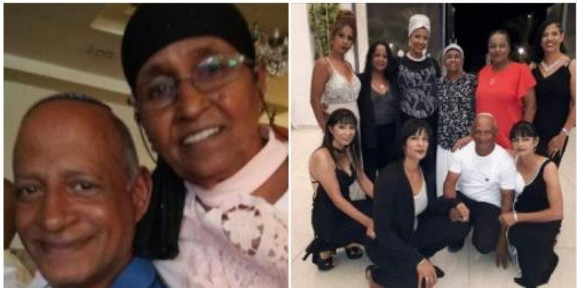
ככל הנראה אח שנפטר