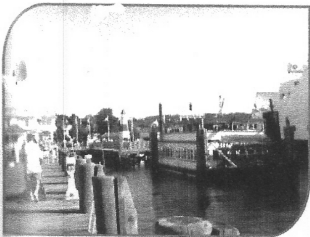
שלווה על הטיילת של סטוני ברוק

אם תמשיכו לאורך כביש 25A לכיוון מזרח, ותפנו שמאלה לבית משפחת תומפסון, תחזו בדוגמה אופיינית לבתים אמריקניים מתחילת המאה ה־18,